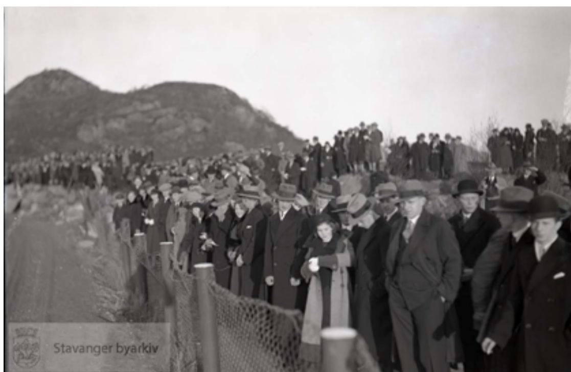
Billøp på Forus travbane 1934-1940