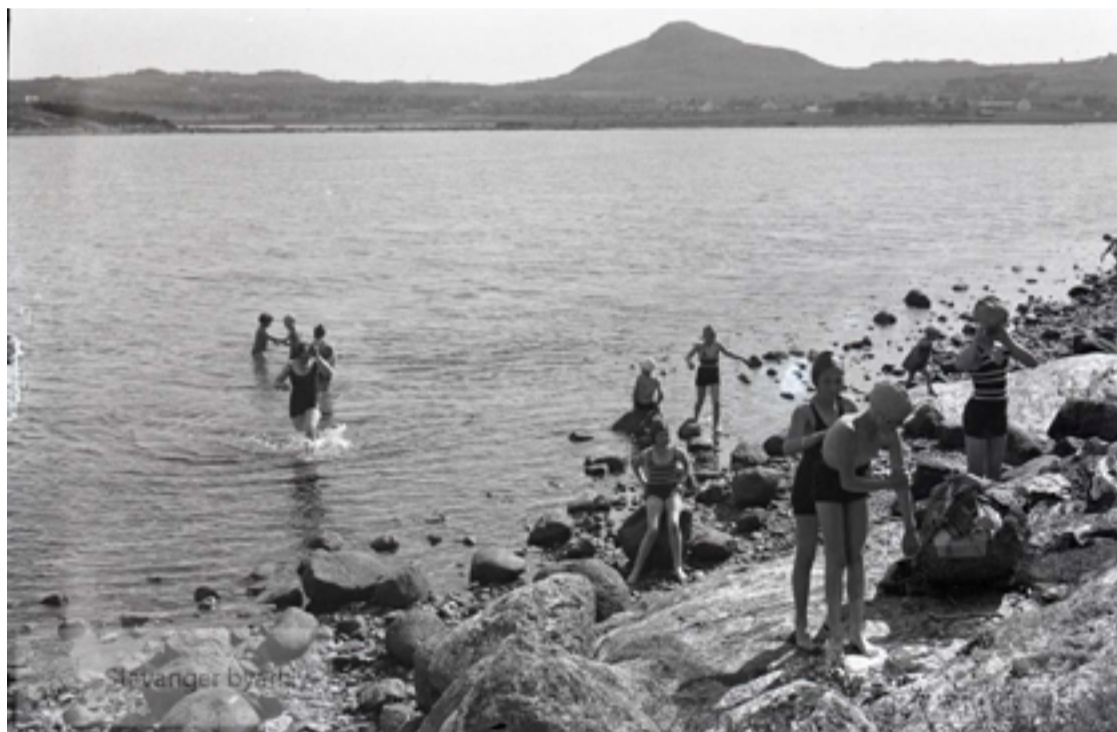
Bading i Gandsfjorden 1930-1940

Min intensjon er å forene industri og byutvikling og skape et samlingssted på Forus for lokalbefolkningen, men også et tilbud som krysser tverrgående forbindelser og manifesterer et kulturelt nettverk for hele regionen. Ved å legge vekt på betydningen av fotgjengervennlige byrom og integreringen av tomten med eksisterende infrastruktur, ønsker jeg å legge til rette for tilgjengelighet og naturlig bevegelse i området. Tomten vil bestå av atelierlokaler og verksteder for kunstnere, samt gallerier, og det vil bli en dynamisk symbiose av liv som skaper eksperimentelle formater og prosjekter som videre inspirerer nye scenarier for stedet.